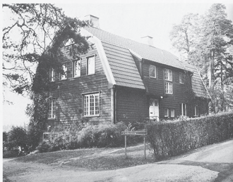
Ett av u-landsavdelningens hus i Ultuna.

På SIDA är det främst lantbruksbyrån (LANT) och Personaltjänstbyrån (IPEB) som har med u-landsavdelningen att göra. U-landsavdelningen består av fyra enheter (se skiss).